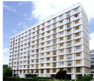
Bernard Zehrftuss, architecte