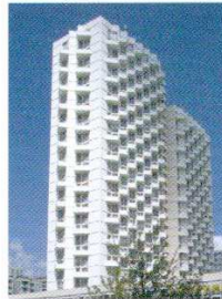
Louis Arretche, architecte