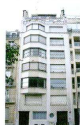
Michel Roux-Spitz, architecte