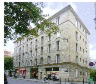
Magot et Méjean, architectes