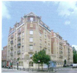
G. Allouque et E. Cornol, architectes