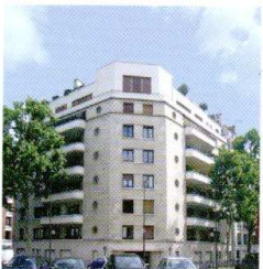
Alli Tur, architecte