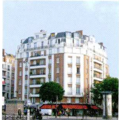
L.O. Heckly, architecte