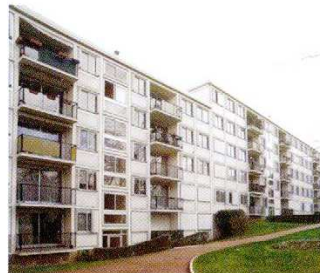
Marcel Lods, architecte